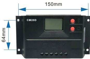
安装孔距— \varnothing 5 Mounting hole Size